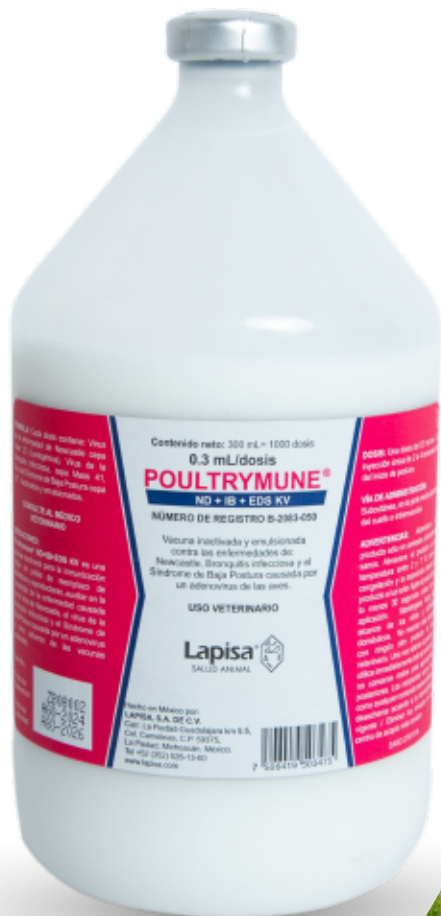
FRASCO CON MIL DOSIS.

Es una vacuna inactivada para la inmunización activa de pollas de reemplazo de ponedoras y reproductoras, auxiliar en la prevención de la enfermedad causada por el virus de Newcastle, el virus de la Bronquitis Infecciosa y el Síndrome de Baja Postura causada por un adenovirus y como refuerzo de las vacunas existentes.